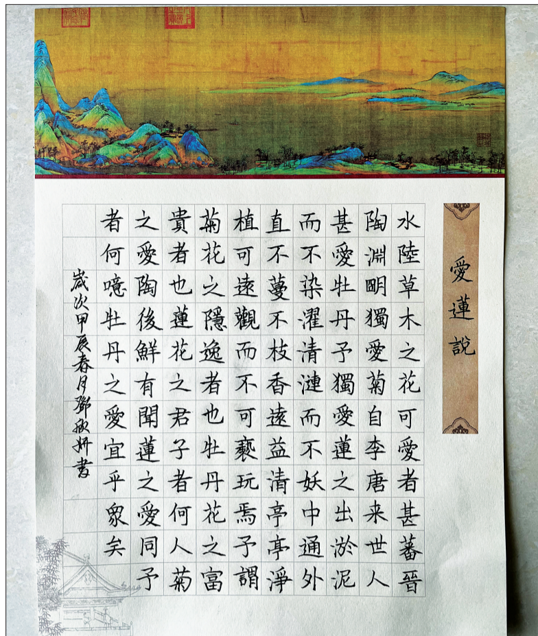
民生中学 五(1)班 邓欣妍