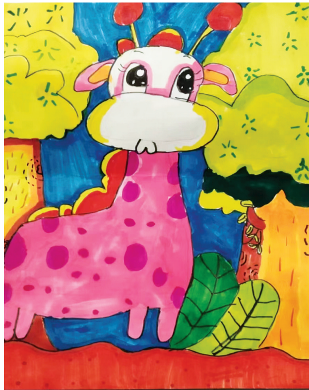
田家庵区第十一小学 二(2)班 王诗若芹