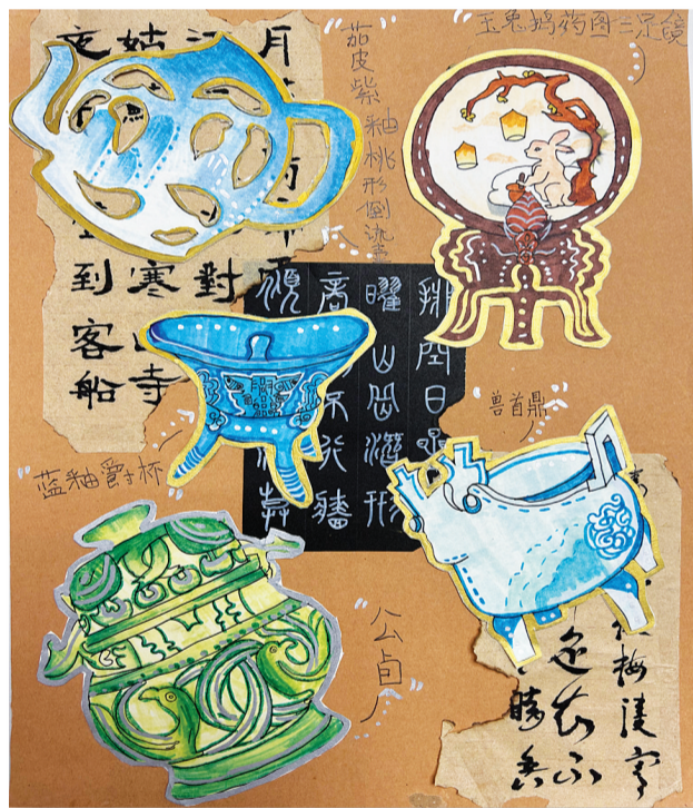
淮南经开区实验学校 二(7)班 夏天佑