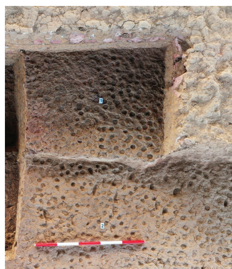
▲填土夯层与夯窝局部(资料图片)