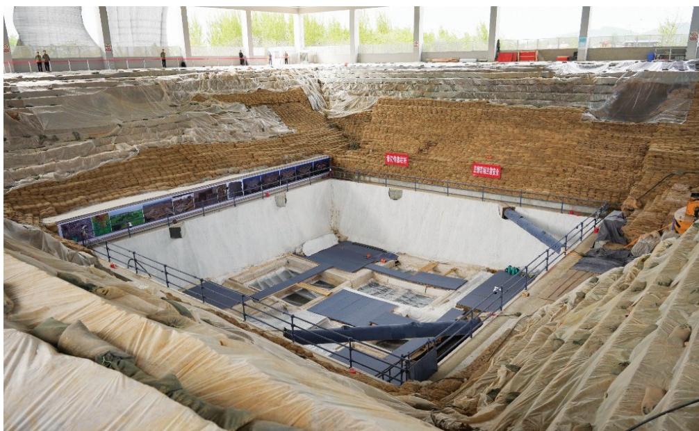
▲武王墩一号墓发掘现场,人站在周边显得十分渺小