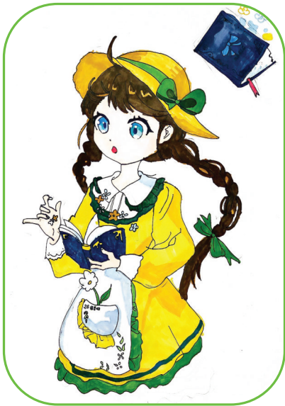
田家庵区第十八小学 三(5)班 孙俊熙

一场大雨后 路边探出几棵春笋 在竹子旁若隐若现 一阵风把竹子吹弯了腰 像为春笋遮住太阳 给它温暖 “它”像春笋的母亲 给予春笋最伟大的母爱