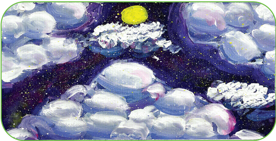
田家庵区第十八小学 四(1)班 韩美欣