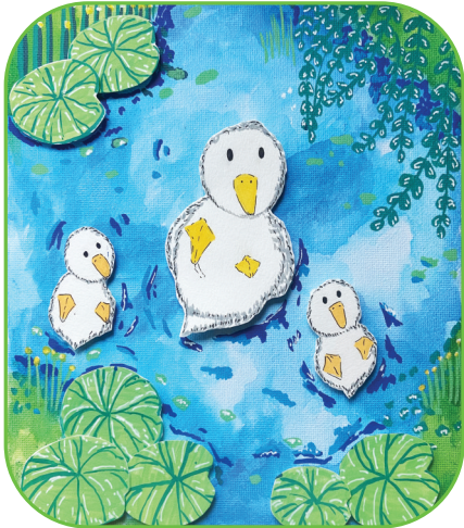
田家庵区第十八小学 二(3)班 曾茗宇