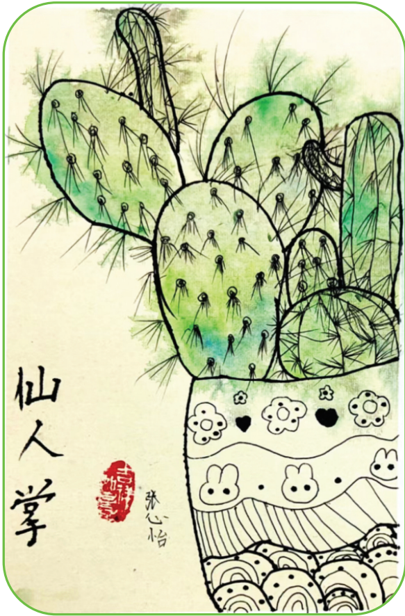
田家庵区第十八小学 一(1)班 张心怡