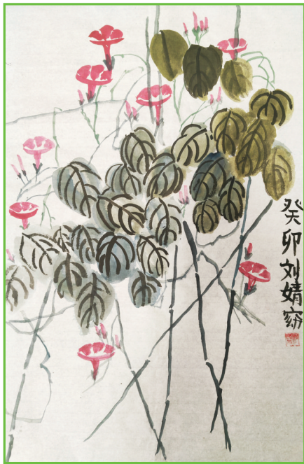
泉山湖中学 四(8)班 刘婧窈