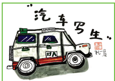
田家庵区第五小学 一(2)班 孔一晨