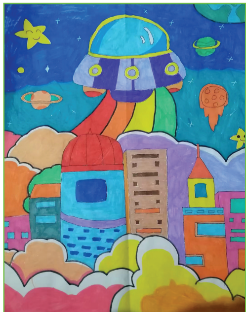
田家庵区第二十一小学 二(5)班 周晨熙

王老师,我要感谢您,感谢您教我知识,让我在知识的海洋遨游;感谢您教我道理,让我能勇敢自信地学习生活;感谢您给我温暖,让我的内心充满爱,也让我能传递爱。王老师,我想对您说:“您辛苦了,谢谢您!” 指导老师:王媛媛