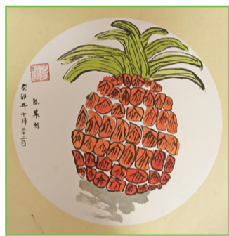
田家庵区第二十一小学 三(4)班 陈紫怡