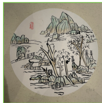
田家庵区第二十一小学 二(1)班 王媛戈