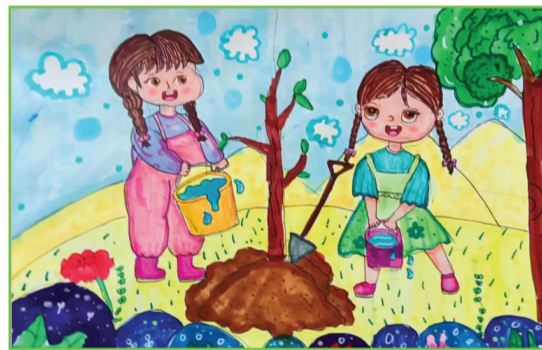
田家庵区第二十一小学 三(4)班 余馨莹