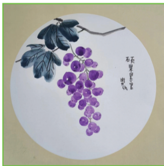
田家庵区第二十一小学 三(4)班 谢思琦

从这件事里我得到了一个启发,赛车别买速度太快的,不然会侧翻。嘻嘻!最重要的是不管做什么事情我们都要去大胆尝试,给自己一个机会,成功或失败是另外一回事,至少自己去尝试、努力过,不负于自己!