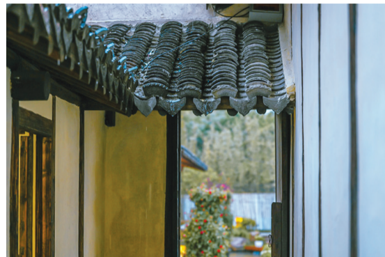
沪郊嘉定新成路街道,正在推进“城中村”改造

“城中村”改造的设计人员说,“竟山”这个名字里的涵义十分深广。山山水水,其实并不在于它有“多大多高”,一个土阜、一处累土,即使起伏只有一点