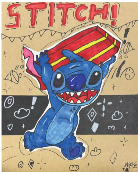
淮南经开区实验学校 二(8)班 程宇恒

此次班主任论坛会的召开,为期末阶段的教育教学工作和即将到来的暑期工作有条不紊、有效推进奠定了基础。与会班主任们纷纷表示,他们会多交流多学习,积极提升班级管理,聚力共进,共同发展。