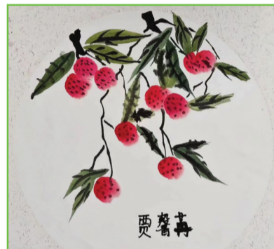
淮师附小本部校区 一(2)班 贾馨苒