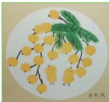
淮师附小本部校区 一(1)班 郎熙然