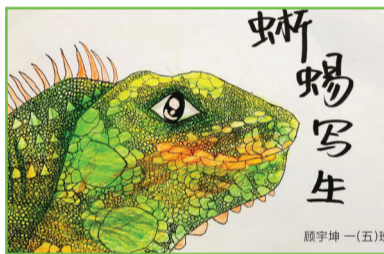
淮师附小本部校区 一(5)班 顾宇坤