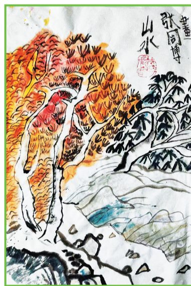
民生中学 三(12)班 张同博