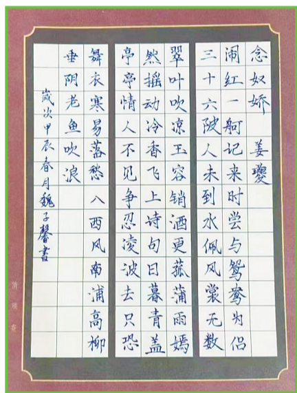
民生中学 五(1)班 魏子馨