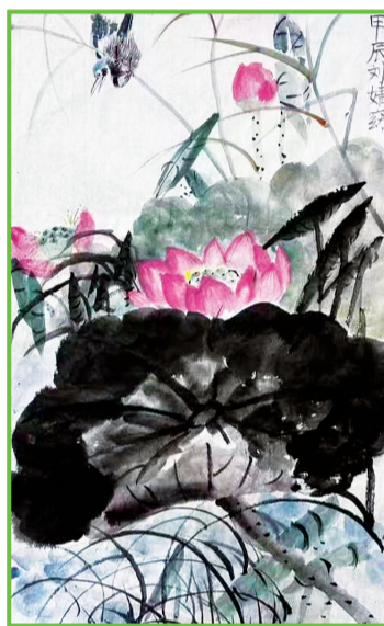
泉山湖中学 四(8)班 刘婧窈