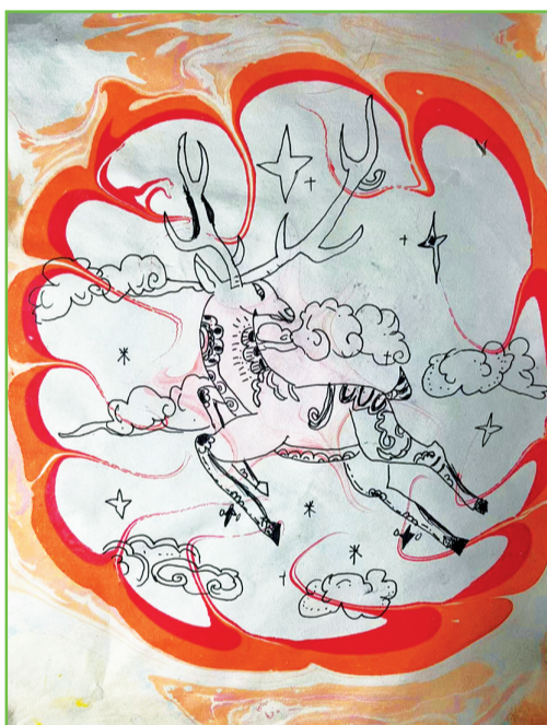
淮师附小山南第十五小学 三(1)班 庞晞予