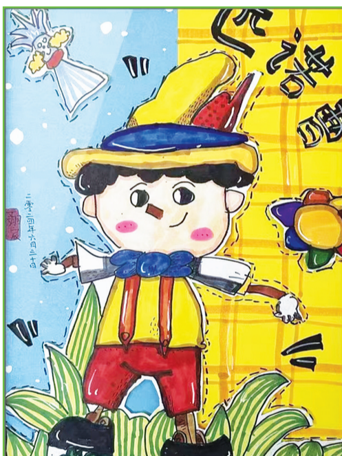
淮师附小山南第十五小学 一(7)班 丁翊宸