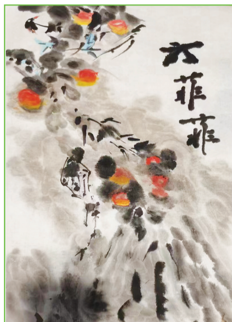
淮师附小山南第十五小学 四(5)班 方菲菲