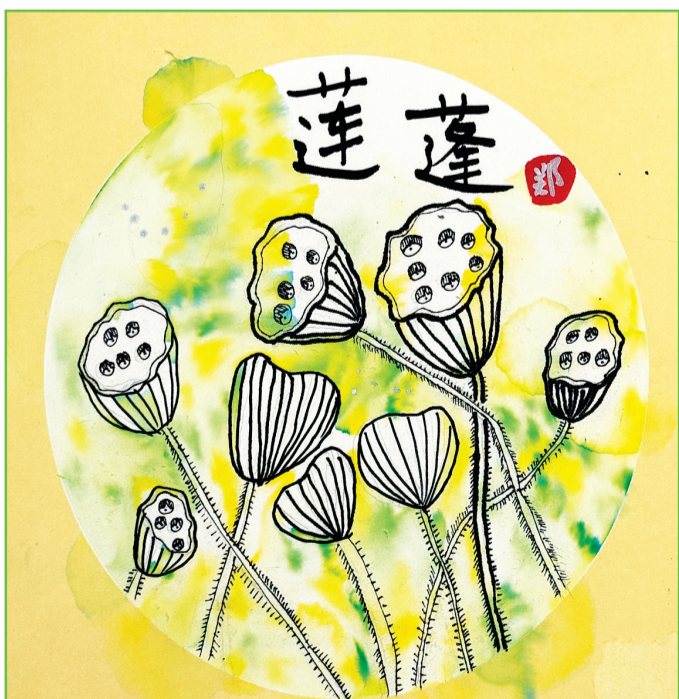
淮师附小山南第十五小学 一(5)班 郑雨辰