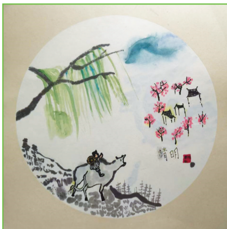
淮师附小山南第十五小学 二(2)班 郝梓萌