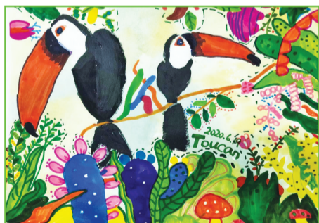
大通区第二小学 六(2)班 顾木子