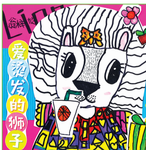
淮师附小南校区 一(二)班 翁梓欣