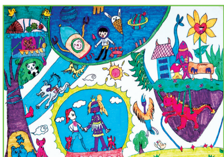
田家庵区第二十一小学 三(5)班 李佳蓉