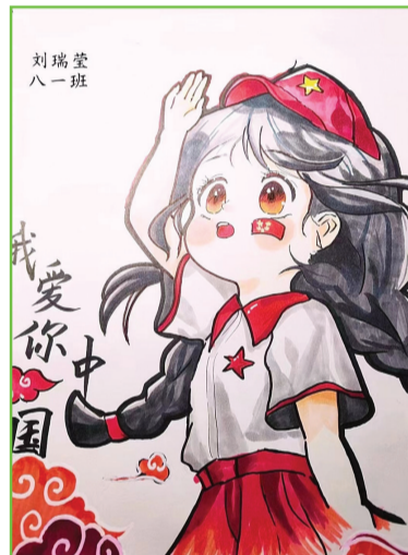
龙湖中学公园校区 八(1)班 刘瑞莹

七一红旗迎风扬,百年征程映日红。 中华儿女齐欢庆,祝福国家永富强。 党旗飘扬心向党,不忘初心永向前。 百年风雨同舟济,万里征途风正劲。 革命先烈血染红,换来今日好时光。 继往开来新征程,民族复兴展宏图。 师生共聚话未来,青春热血谱华章。 愿我中华永昌盛,世界东方放光芒。