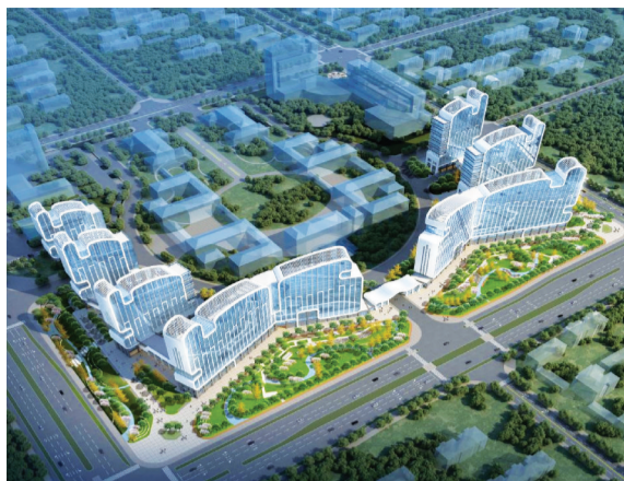
淮南大数据产业智算中心(效果图)

本报讯(记者 廖凌云 摄影报道)10月8日上午,2024年全省第四批重大项目开工动员会在合肥举行。我市在淮南分会场汇报重大项目开工情况。