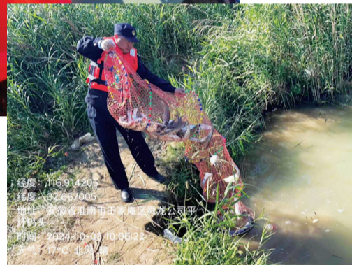
► 渔政人员在放生钓鱼人的渔获物

15:26 | 2024-10-02 星期三 晴 21°C 田家庵区·田家庵海事码头