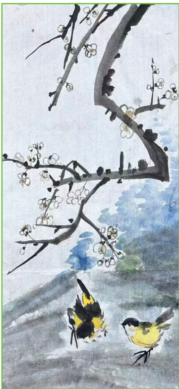
淮师附小山南第十小学 四(1)班 顾雨桐