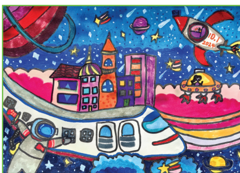
淮师附小山南第十小学 二(1)班 程茹忆