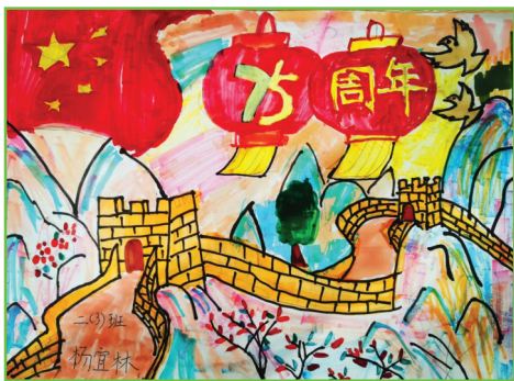
淮师附小山南第十小学 二(3) 杨宜林

中国奥运健儿们让我感到无比自豪,他们奋力拼搏,为国争光,用行动诠释了奥林匹克精神,展现了中国体育的强大实力和风采。我要以他们为榜样,时刻鞭策自己,更要学习潘展乐不断突破自己的精神,在学习的赛道上不畏艰难,勇往直前!