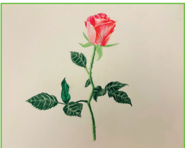
淮师附小山南第十小学 四(3)班 程永馨