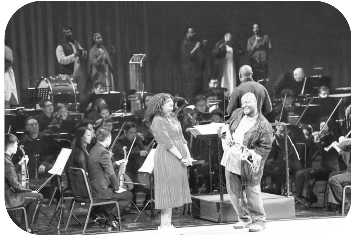
开普敦歌剧院的艺术家在歌剧《波姬与贝丝》中的精彩表现

一首乔治·格什温谱写的《夏日时光》悠扬唱响,引出歌剧《波姬与贝丝》的跌宕故事。10月12日和13日,这部20世纪极负盛名的作品在保利剧院上演,为第27届北京国际音乐节正式收官。自10月5日开幕以来,为期一周的音乐节以9场音乐会和多场衍生活活动,再次为北京观众献上一年一度的音乐盛宴。