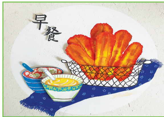
田家庵区第十八小学 二(3)班 曾茗宇