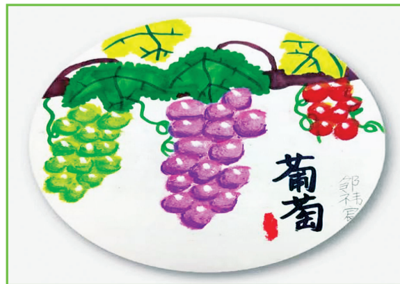
田家庵区第十八小学 三(6)班 邹祎宸