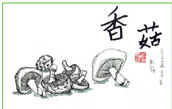
田家庵区第十八小学 二(1)班 张心怡