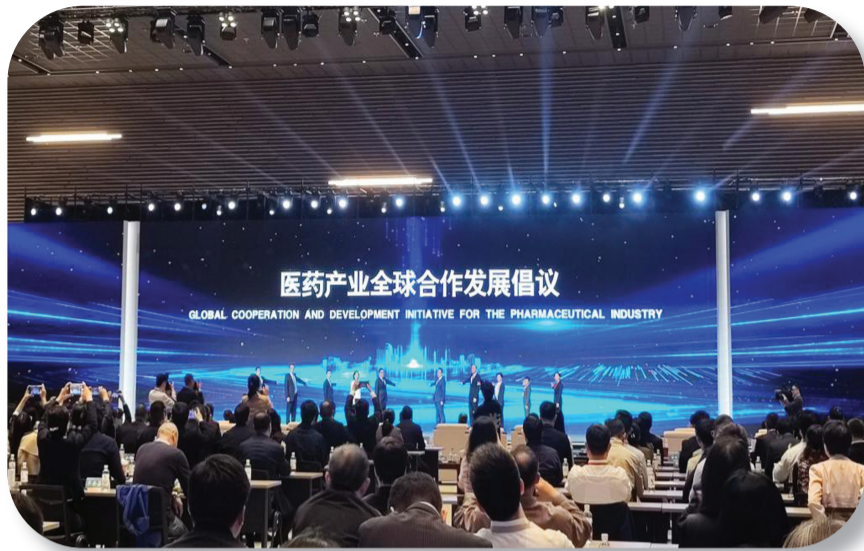
《医药产业全球合作发展倡议》发布现场。

新华社上海11月16日电(记者 董雪 顾天成)在11月16日举行的2024中国医药工业发展大会与上海国际生物医药产业周上,《医药工业“十四五”期间产业升级突出进展和产业技术未来发展重点领域》报告正式发布,总结了我国“十四五”期间医药产业的突出进展。