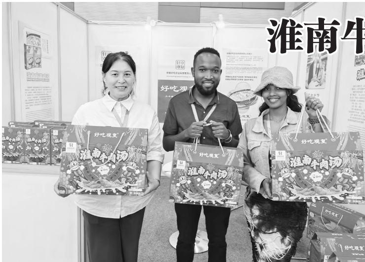
淮南牛肉汤香飘海外(资料图)

本报讯(记者 廖凌云)12月9日,淮河早报、淮南网记者从市市场监管局获悉,我市申报的《预包装淮南牛肉汤生产技术规程》已获省市场监管局立项。这是今年继《淮南牛肉汤食品安全标准》获批立项后的又一项淮南牛肉汤省级地方标准。