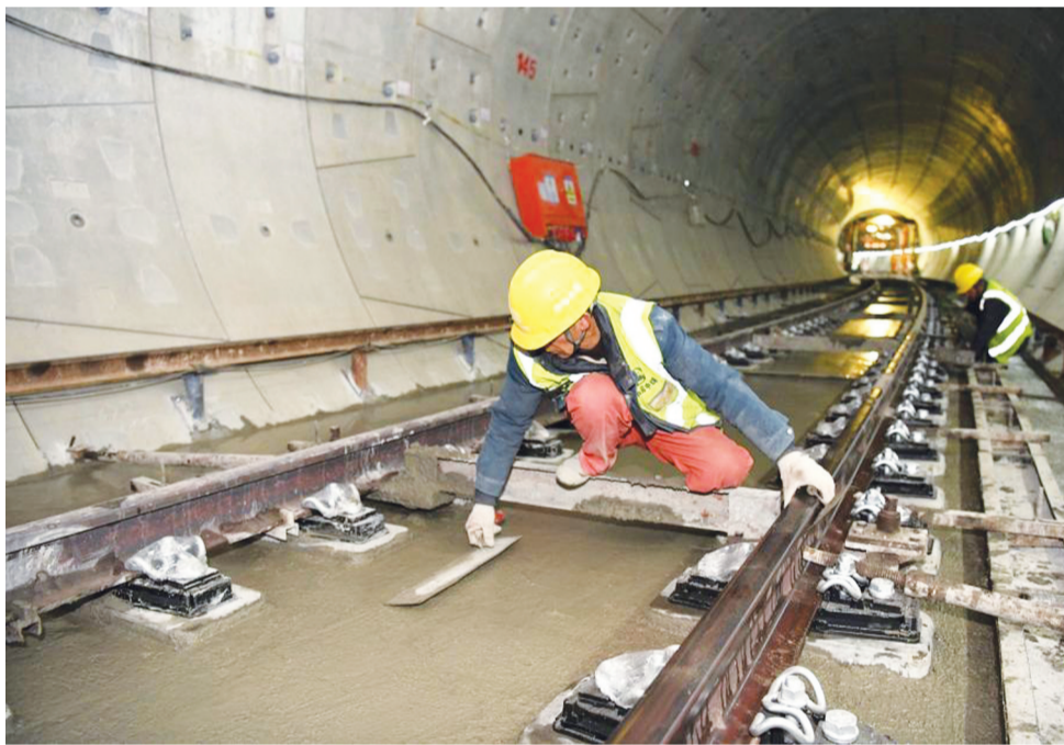
中铁五局建设者在合肥新桥机场S1线正线轨道铺设道床混凝土浇筑施工现场作业。