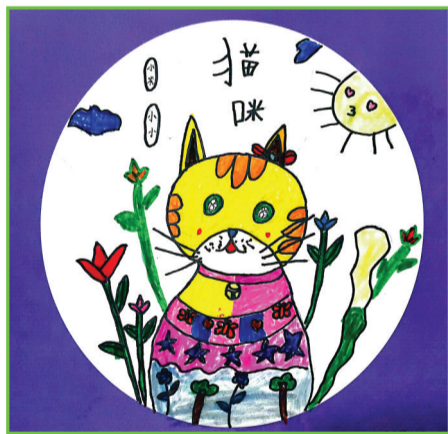
淮南市第二十六中学 一(2)班 顾子默