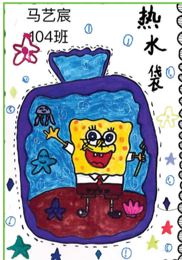
淮南市第二十六中学 一(4)班 马艺宸