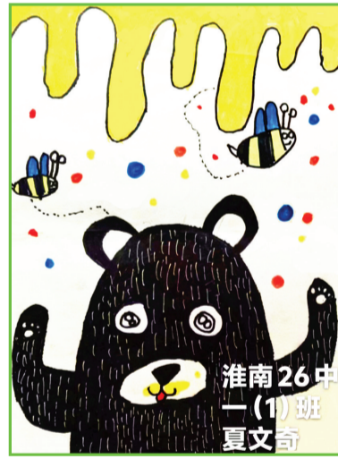
淮南市第二十六中学 一(1)班 夏文奇