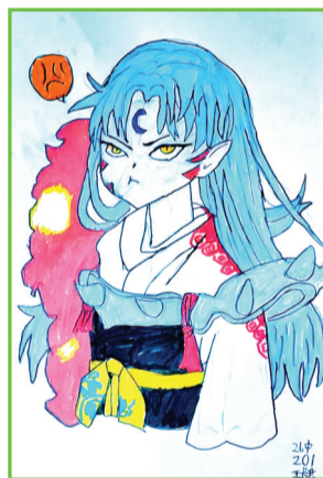
淮南市第二十六中学 二(1)班 王长君