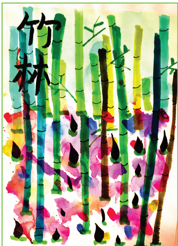
淮师附小山南第十小学 一(3)班 蒋淇莹