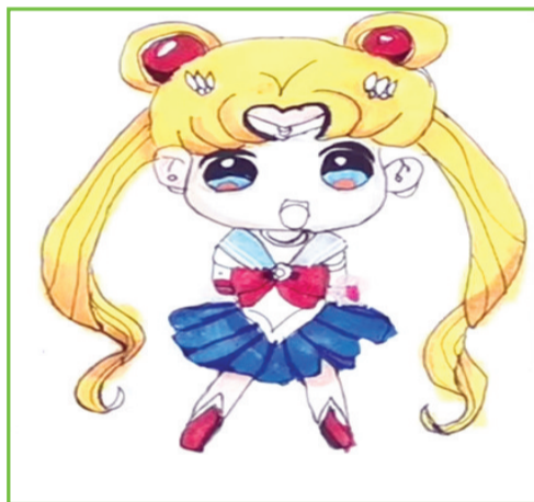
淮师附小山南第十小学 二(3)班 杨宜林

这本书语言诙谐幽默,故事贴近孩子生活,情感细腻动人。它告诉我们,成长路上难免遭遇挫折,青春期烦恼不断,但关键要不逃避,勇敢面对。就像坂卷,正因直面问题,脾气才得以改善。我介绍了这么多,精彩情节还未详述,留个悬念,大家快来一探究竟吧!