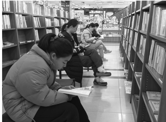
书香淮南,市民过别样文化年

货”排队结账,笑意盈盈。这个春节,书店不仅承载着市民对知识的渴望,更成为传承文化、滋养心灵的新年俗空间。