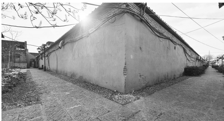
位于九龙岗镇的报社巷

截至2月5日,热播剧《六姊妹》中多次出现《淮南日报》镜头,并进行聚焦特写。《淮南日报》再次勾起了大批观众的时代记忆,其实,这部电视剧在九龙岗镇拍摄过程中,其取景地就与“报社巷”多有重叠。