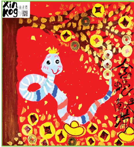
淮南市第二十六中学 一(4)班 徐彦哲