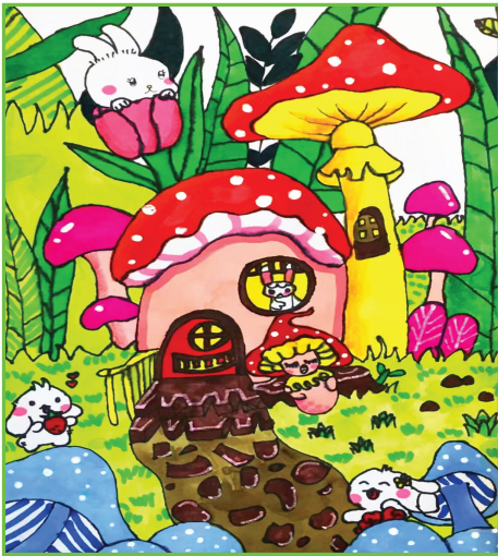
田家庵区第三小学 一(1)班 张欣晨