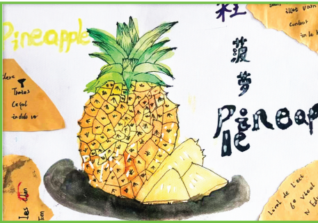
田家庵区第十四小学 一(1)班 程婉婷