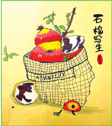
朝阳中学 二(4)班 郭梓沐