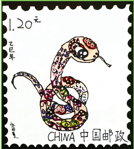
淮师附小山南第十五小学 一(4)班 张雨蔓