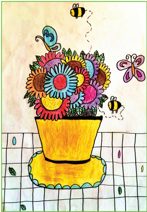
田家庵区第十八小学 一(6)班 汤玉宸

淮楚文化是我们淮南宝贵的财富,我要好好学习,把淮楚文化传承下去,让更多人了解淮南的美好,领略淮楚文化魅力。欢迎大家来到淮南!