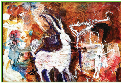
田家庵区第十八小学 二(3)班 陶文