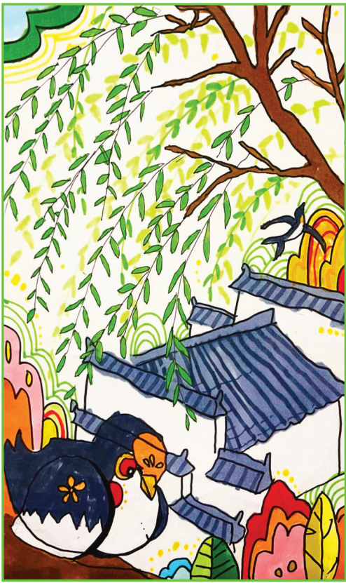
田家庵区第十八小学 一(4)班 杜沐校