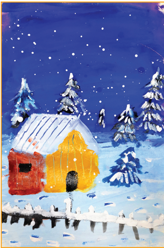
淮师附小山南校区 一(16)班 姜毅明