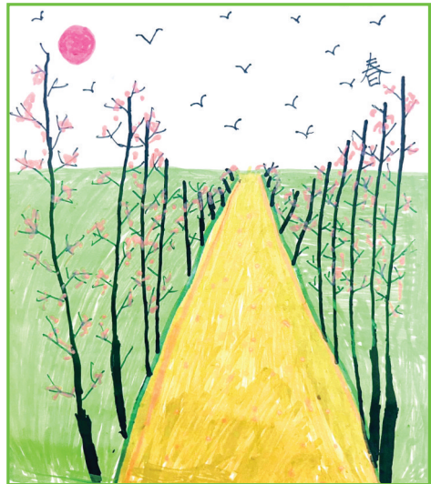
淮师附小山南校区 二(8)班 付家乐