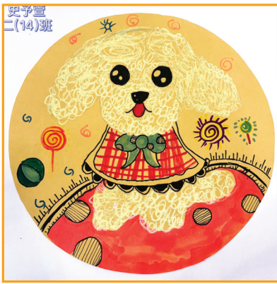
淮师附小山南校区 二(14)班 史予萱