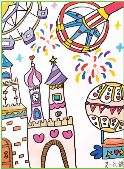
淮南市第二十六中学 一(1)班 苏云旗