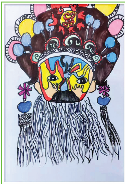
淮师附小山南第十小学 二(3)班 李瀚宜