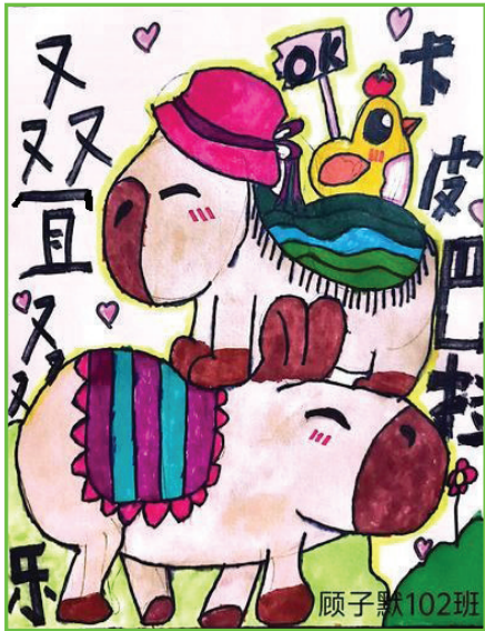
淮南市第二十六中学 一(2)班 顾子默

《哪吒之魔童闹海》不仅仅是一部动画电影，更是一部关于成长、勇气 and 责任的启示录。它让我们看到了一个少年在面对困境时的不屈不挠，在面对挫折时的勇敢抗争。它告诉我们，无论生活中遇到多大的困难，我们都要坚守自己的信念，勇敢地面对挑战。就像哪吒一样，即使身处黑暗，也要努力发光，用自己的力量去守护那些我们所珍视的东西。