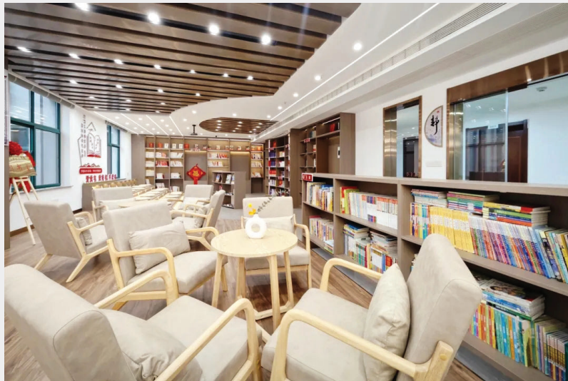
图书室布局 温馨,藏书丰富

市民政局相关负责人表示,清单将通过社区宣讲、政务平台智能推送等方式推动“人找政策”向“政策找人”转变,并建立动态更新机制,确保救助政策“看得懂、用得上、办得快”。此次全省首创的集成化清单,为构建分层分类、智慧高效的社会救助体系提供了“淮南样本”。