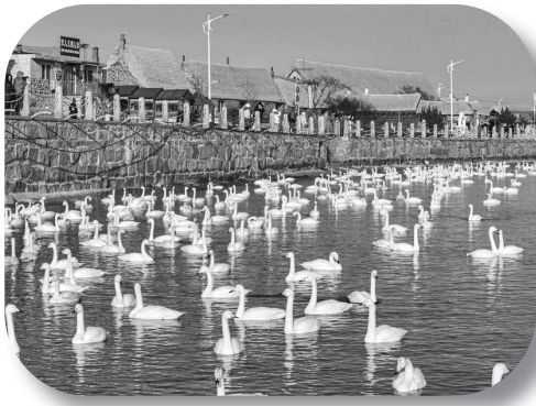
烟墩角村的大天鹅