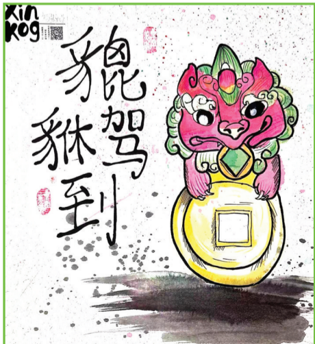
泉山湖中学 四(8)班 殷弘毅