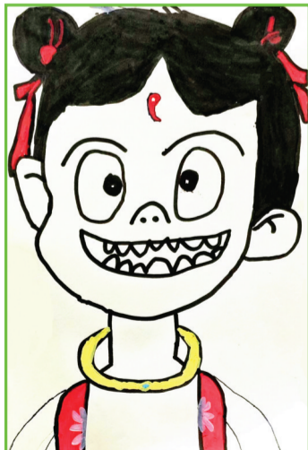
淮师附小山南校区 二(20)班 李伟溪