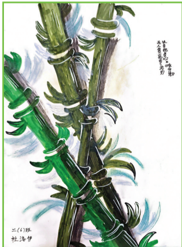
泉山湖中学 二(6)班 杜洛伊

此次活动有效加深了学生对交通法规的理解,进一步提升了学生尊重生命、安全出行的自觉意识,对保障个人交通安全、维护校内外交通安全秩序起到了积极作用。学生们纷纷表示,今后将从自身做起,践行文明出行。