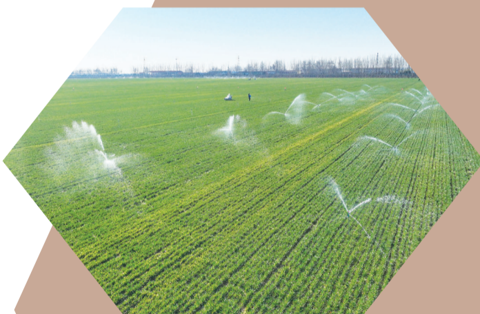
3月18日,河北省晋州市周家庄乡第一生产队的喷灌系统在为小麦进行喷灌作业。