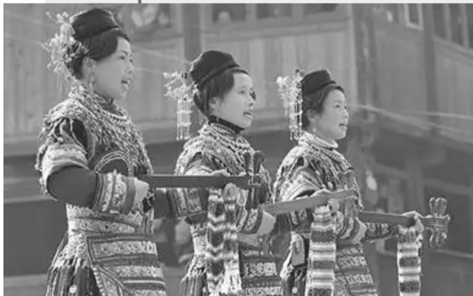
侗族琵琶歌表演现场