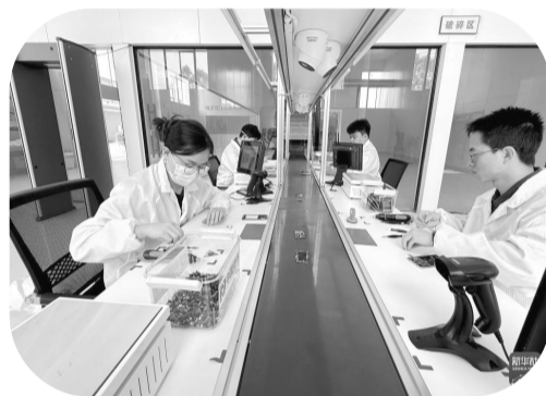
工作人员拆解手机闪存部件,送入破碎装置。