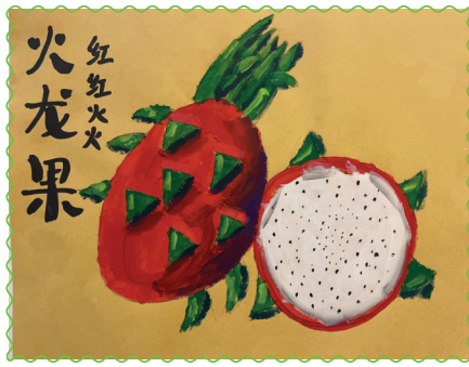
淮师附小洞山校区 二(2)班 鄢奕然