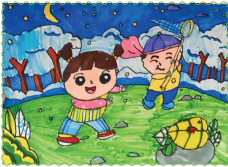
淮师附小洞山校区 二(3)班 朱明神旭