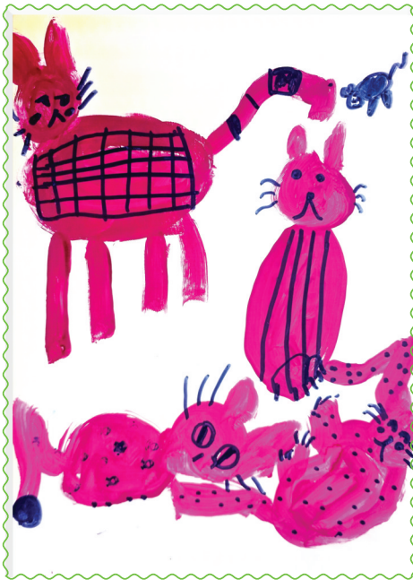
淮师附小洞山校区 三(3)班 应沐心