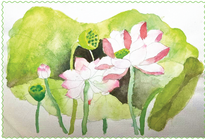
淮师附小洞山校区 五(2)班 蔡金洋