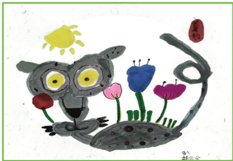
田家庵区第十六小学 一(5)班 胡云朵