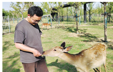
游客打卡春申鹿苑

据了解,2024年7月20日,春申湖公园正式对外开放,秉持着“亲子互动+生态体验+自然教育”的理念,丰富游客的游玩体验。1400平方米的奇迹数字体育运动馆让亲子家庭体验未来感十足的科技运动;在春申鹿苑与萌宠乐园,小朋友们可与梅花鹿、小羊等十几种小动物亲密互动,开启自然教育之旅;煤矿记忆打卡点见证城市变迁,灯光秀演绎为自然风光添彩;园内还设有无动力乐园、呆呆咖啡、小火车、美食市集等,进