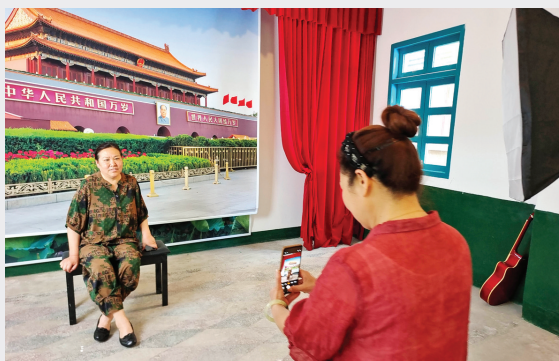
市民到国营红旗照相馆分馆打卡留念

据了解,国营红旗照相馆分馆建造于20世纪五、六十年代,为两层砖混结构,正面立墙镌刻“国营红旗照相馆分馆”等字,并在门楣上方悬挂一方匾额,书写“红旗照相”四字。照相馆一楼为接待区,二楼为拍照区。照相馆主要提供各类摄影服务,曾是淮南市各企事业单位、中小学校拍摄集体照和个人拍摄生活照、证件照的首要选择,彰显了“计划经济”时期,淮河路作为全市的经济中心、引领全市服务业蓬勃发展的时代风貌,也见证了无数淮南人的重要时刻,承载着淮南的城市记忆和市民情感。