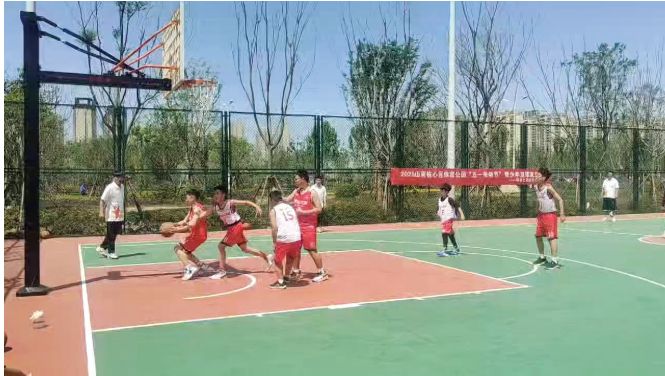
青少年在公园篮球场打球

本报讯(记者 廖凌云 摄影报道)5月1日上午,淮南高新区城市公园再添新丁,如意公园项目圆满完成各项建设任务后,正式向市民游客开放。当天,公园里处处洋溢着欢声笑语,孩子们兴奋地跑向游乐设施,家长们则笑着跟在后面。步道两旁,绿树成荫,几位老人正在拉二胡、唱戏;篮球场上,青少年们来回奔跑,洋溢着青春活力。