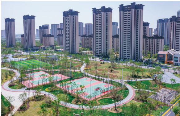
如意公园鸟瞰图(局部)