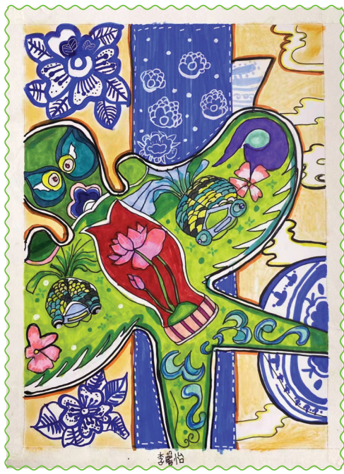
田家庵区第十八小学 一(1)班 李馨怡