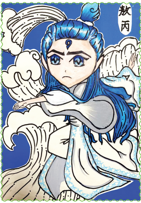
田家庵区第十八小学 五(1)班 韩美欣

不一会儿,我们就挖了不少竹笋。虽然有点累,但看着这些劳动成果,我的心里美滋滋的。