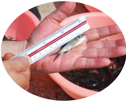
▼ 水产技术人员用尺子确认鱼苗的长度

每年6月6日是全国“放鱼日”，今年是第十一个全国“放鱼日”。在此期间，淮南市及潘集区农业农村局分别在淮河干流淮南祁集段开展增殖放流活动，共放流各类鱼苗545万尾。