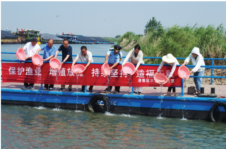
◀ 增殖放流活动前的展示环节