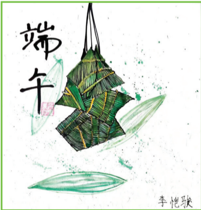
淮师附小山南校区 一(15)班 李恺骏