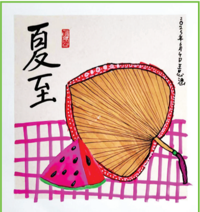
淮师附小山南校区 一(16)班 王思涵