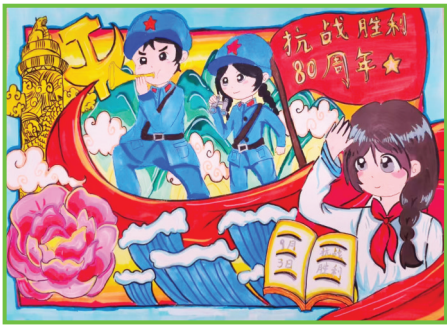
淮师附小山南校区 二(3)班 邵李沐晨

洁白如雪，爪子是棕色的，我想给它取名海德薇。 我渴望养这样一只既温顺又可爱的小猫头鹰，让它陪伴我度过美好时光。