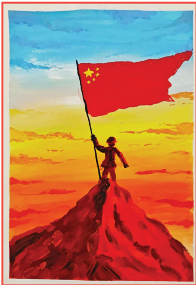
淮师附小山南校区 一(2)班 许安然

看着重新安静下来的客厅,我心想:原来勇敢不是不害怕,而是像奶奶和咪咪一样,遇到困难也能镇定自若,笑着把“不速之客”送出门;或者像我这样,即便心怀恐惧,也会为了保护同伴鼓起勇气直面困难。