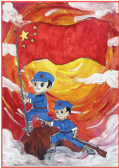
淮师附小山南校区 一(13)班 周芸熙