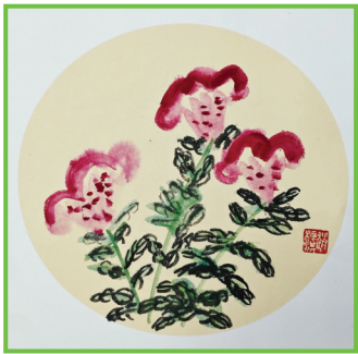
淮师附小山南校区 二(14)班 赵梓淇