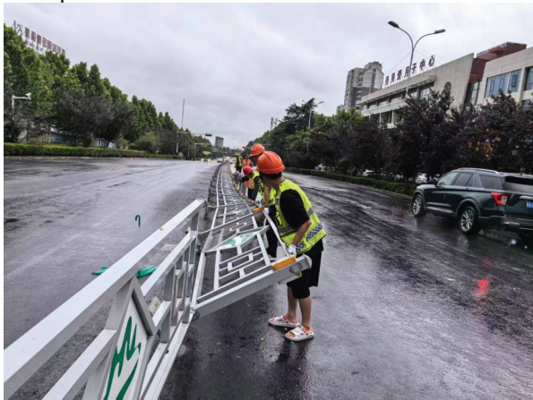
施工人员在G328谢家集区施工路段将被吹倒的中央隔离护栏扶正