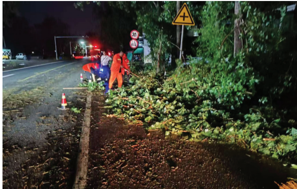
凤台公路分中心养护应急人员在清理折断的树木

本报讯(记者 张明星 通讯员 陈修利 摄影报道)6月14日下午,我市出现极端恶劣天气。市交通公路部门迅速启动应急预案,快速处置突发险情,确保市域内国省干线公路安全畅通。