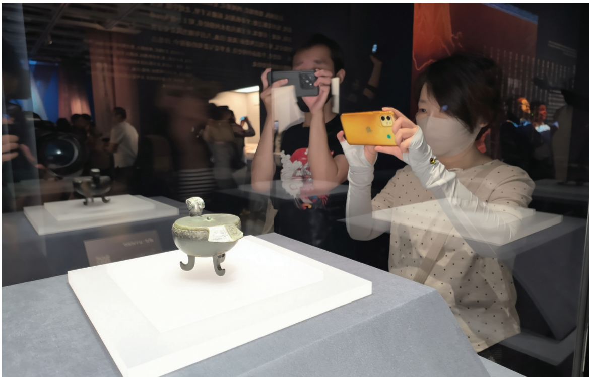
“楚风烈——安徽楚文化文物精品展”开幕吸引众多群众前来观展

本报讯(记者 廖凌云 摄影报道)6月15日上午,2025上海文化遗产季“楚风烈——安徽楚文化文物精品展”开幕式暨闵行·淮南·保山·喀什(泽普)四地文旅推介活动在上海市海派艺术馆举行。本次活动以文物交流为纽带,以文旅协作为桥梁,既展现了长三角与中西部地区的文化共鸣,也为区域协同发展注入了新活力。