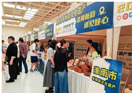
四地非遗集市人气火爆