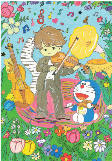
淮师附小山南校区 一(6)班 陶纯钧