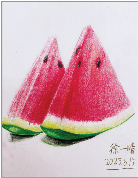
淮师附小洞山校区 二(3)班 徐一晴