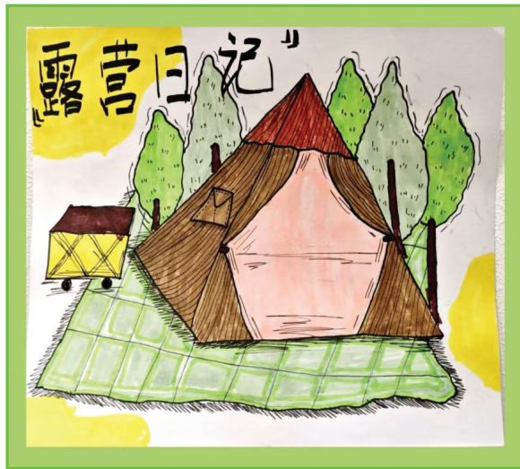
淮师附小洞山校区 一(1)班 梁桐瑜