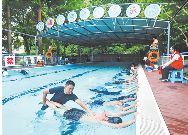
浙江省湖州市第五中学教育集团体育教师在教孩子们学习游泳