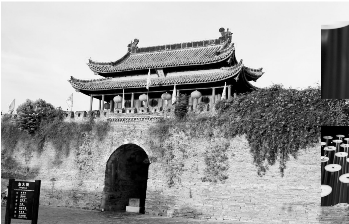
寿州古城宾阳门(资料图)