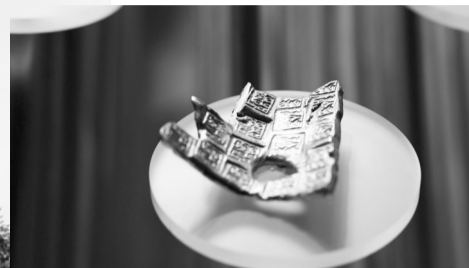
安徽楚文化博物馆馆藏， 国家一级文物，楚金币。