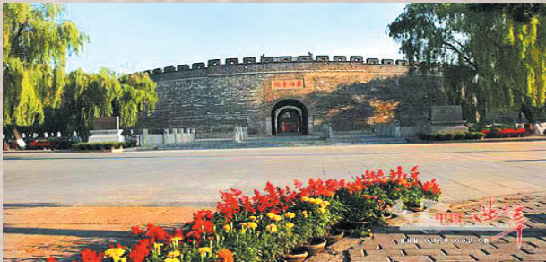
曲阜市明故城

以上是《史记·六国年表》的记载,而《鲁周公世家》简略了楚封鲁顷公于莒为附庸的过程,直接说“楚考烈王伐灭鲁。顷公亡,迁于下邑”。下邑就是楚国的普通城邑。至于费国,《先秦古国志》(华文出版社)说,“楚考烈王灭鲁。费国在鲁国南边,也应该是在这段时间内为楚国灭亡”。