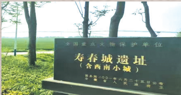
战国楚都寿春城遗址

50年过去,考烈王即位时,子姓宋国(建都今河南商丘市睢阳区)、姬姓滕国(建都今山东滕州市西南)、任姓薛国(建都今山东滕州市西南)、己姓莒国(建都今山东莒县)、己姓邾国(建都今山东郯城县西北)、风姓任国(建都今山东济宁市任城区)、任姓邳国(建都今江苏睢宁县古邳镇)等7国已经灭亡;姬姓卫国(建都今河南濮阳市华龙区)已沦为魏国附庸,成为魏的国中之国;剩余4国为姬姓鲁国及其衍生的费国,曹姓邹国及其衍生的郕国,后来都被楚考烈王一一灭之。