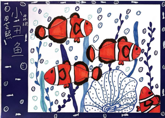
淮师附小山南校区 一(13)班 周芸熙