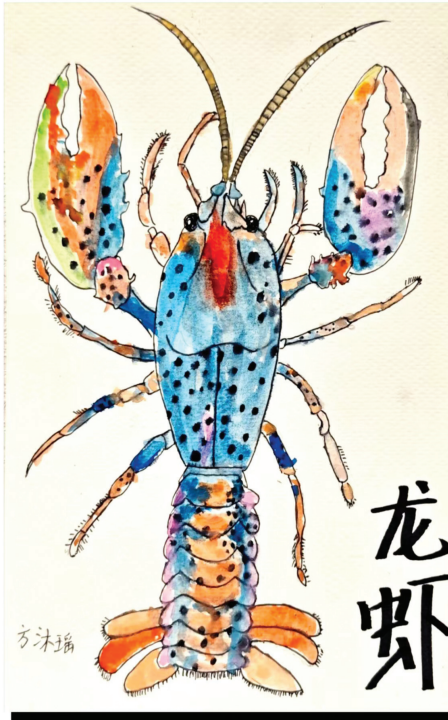
淮师附小山南校区 二(16)班 方沐瑶