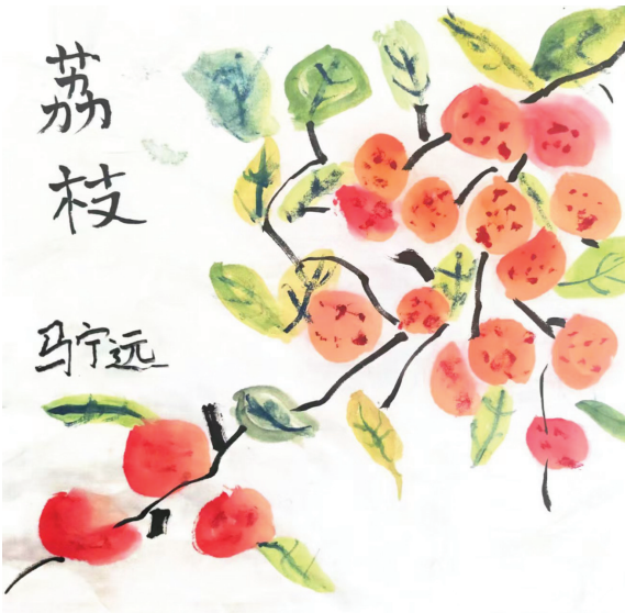
淮师附小山南校区 一(6)班 马宁远