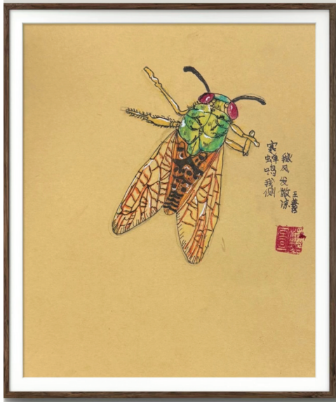
淮南经开区实验学校 五(6)班 王英哲