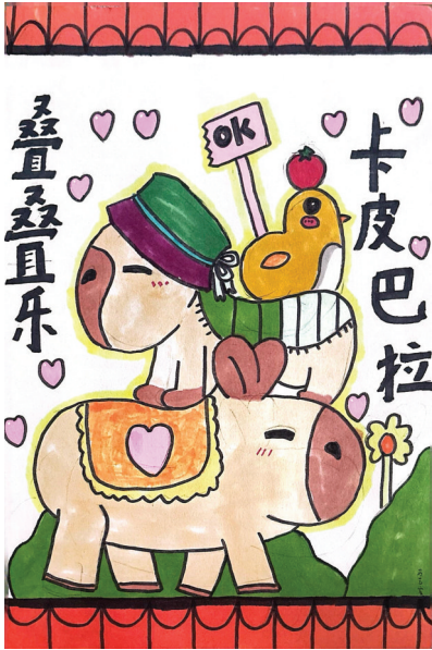
淮南市第二十六中学 一(4)班 马艺宸