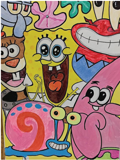
朝阳中学 四(4)班 王梓馨

说:“谢谢爸爸给我买的柠檬!”爸爸温柔地摸了摸我的头,笑着说:“傻孩子,跟爸爸还说什么谢谢。只要你喜欢,爸爸就开心。” 是啊,这就是家人之间最温暖的爱。不需要太多的言语,一个柠檬,一个微笑,就足以让我们感受到彼此之间最真挚的心意。 指导老师:胡娇